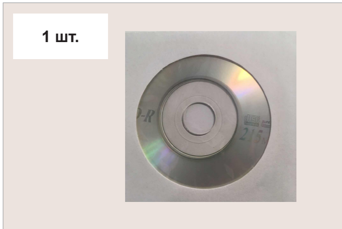
Диск с драйверами