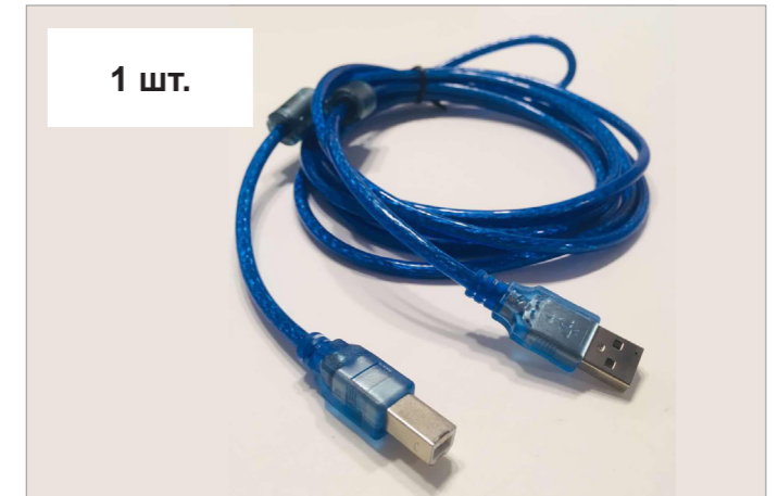
Кабель USB A - USB B