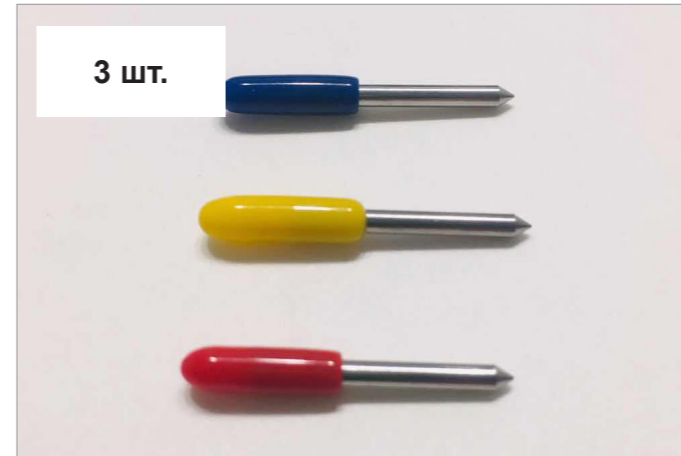
Ножи (тип Roland)